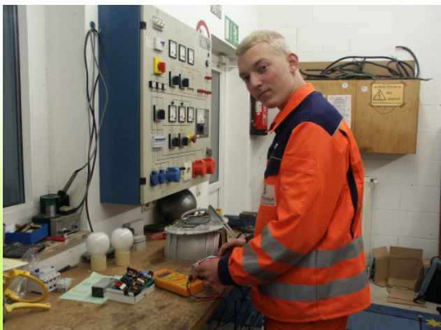
Der Auszubildende in der Lehrwerkstatt